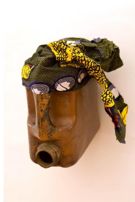
Romuald Hazoumé, Wax Bandana , 2009, matériaux recyclés © ADAGP, Paris, 2018