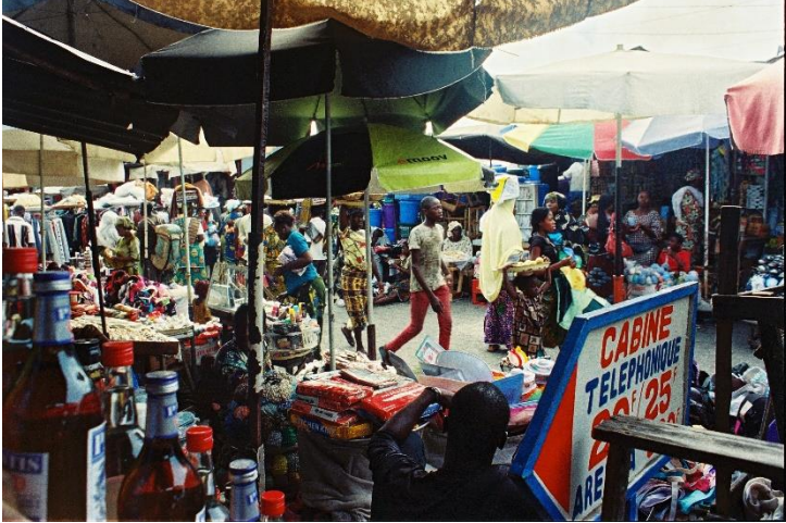
Grand marché de Cotonou, 2011, Bénin

Pour cela, il récupère des objets abandonnés dans les rues de Cotonou, la capitale du Bénin, puis les assemble dans son atelier pour en faire des sculptures uniques.