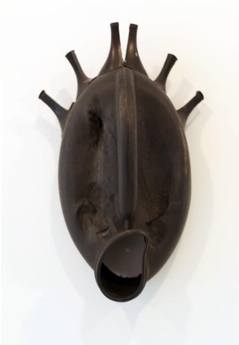
Romuald Hazoumé, Pic à seau , 2015, matériaux recyclés, exposition à la Galerie Gargosian en 2016 © ADAGP, Paris, 2018, photo : Éric Simon

L'artiste s'empare de ces codes qu'il connaît bien pour mieux les détourner. Ses masques à lui ne sont certainement pas destinés à être portés !