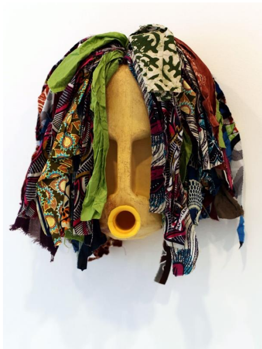
Romuald Hazoumé, Nanawax , 2009, matériaux recyclés, exposition à la Galerie Gargosian en 2016 © ADAGP, Paris, 2018, photo : Éric Simon

Une chevelure en bataille , des yeux vides et une bouche ronde suffisent pour évoquer un visage.