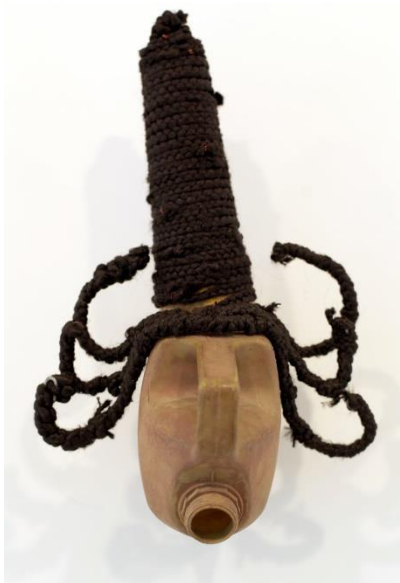
Romuald Hazoumé, Nanawax , 2009, matériaux recyclés, exposition à la Galerie Gargosian en 2016 © ADAGP, Paris, 2018